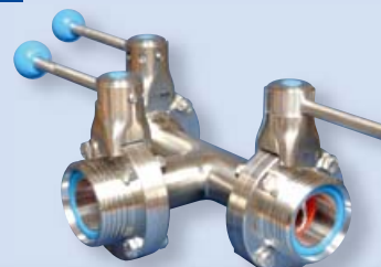
4317 Klapka trojcestná