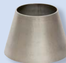
3060 Potrubní redukce