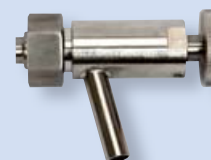
5306 Vzorkovací kohout K/M