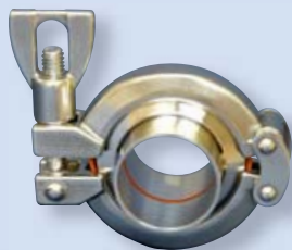
2125 Spojka Clamp