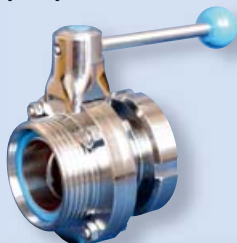
4304 Klapka příčná KM-G