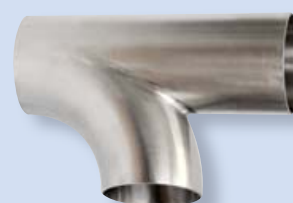
3030 Oblouková odbočka