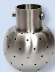
5318 Sprchovací hlavice stacionární