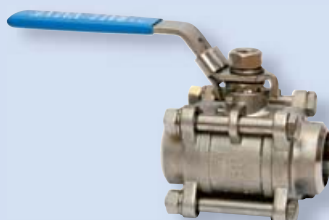
4065 Kulový ventil - trojdílný