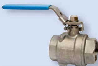
4064 Kulový ventil - dvojdílný