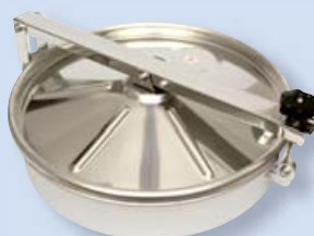
6022 Průlez kruhový