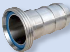
2051 Hadicový nástavec