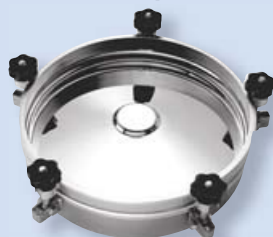
6023 Průlez kruhový