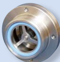
5082D Zpětná klapka S-G